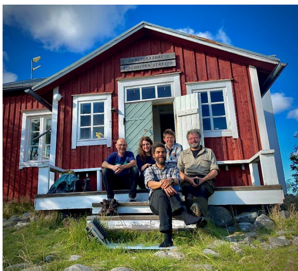
Den biologiska stationen, med stationschef (framför öppna dörren) och några av 2022 års volontärer.