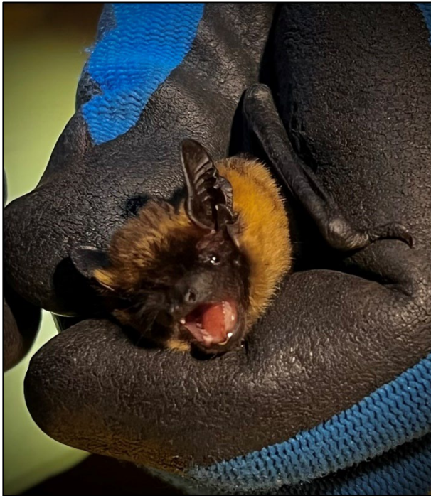
En fångad nordfladdermus hanteras.