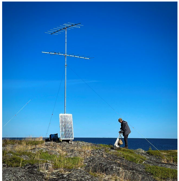
En av de mindre mottagarstationerna.