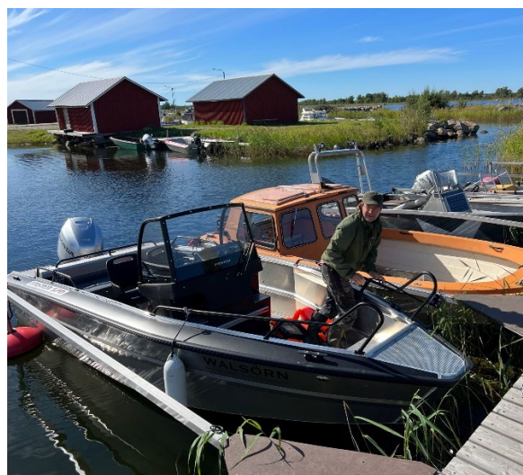
Hamnen i Svedjehamn, med stationschefen och stationens båt i förgrunden.