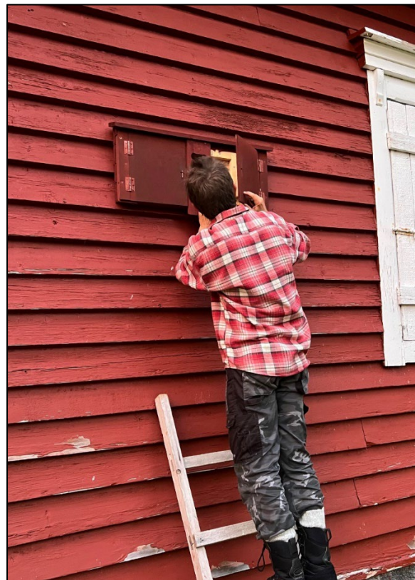
Öppningsbara holkar används för att fånga fladdermöss på dagen.