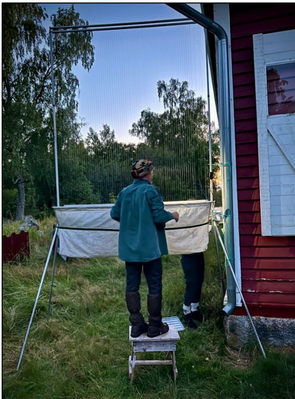
En harpfälla invid den gamla fyrvaktarbostaden.