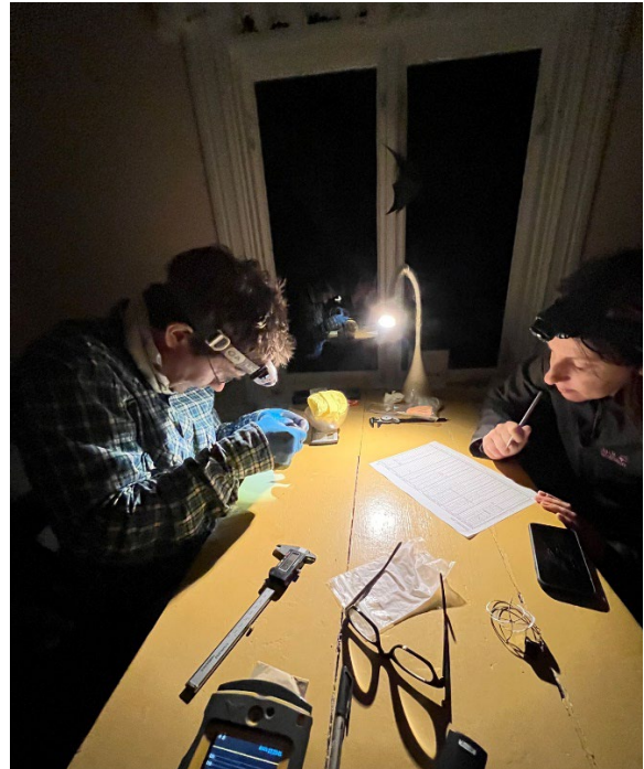
Labbet i fyrvaktarbostaden.